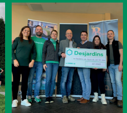
La Fondation du Havre du Lac-St-Jean