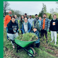
Forêt et jardins nourriciers de Roberval