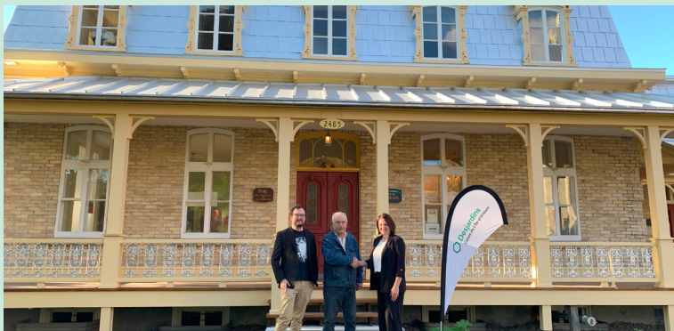
Fondation François-Lamy, restauration de la Maison de nos Aïeux

Grâce à ses leviers financiers, la Caisse soutient de nombreuses initiatives sur son territoire dans divers secteurs d'activité et selon les priorités d'investissement dont elle s'est dotée. C'est en faisant affaire significativement avec votre caisse et en participant à sa vie démocratique que des projets structurants pour notre collectivité voient le jour.