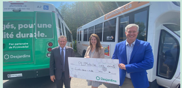
PLUMobile, soutenir l'offre de transport collectif et adapté