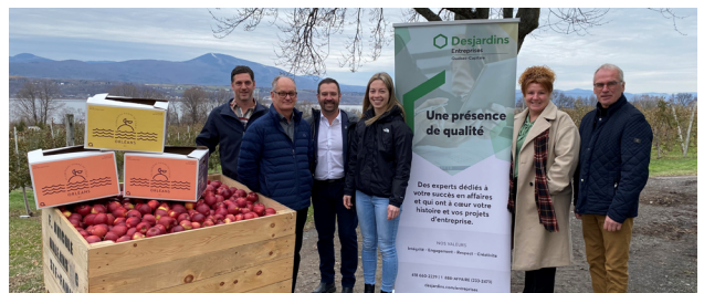
Les Vergers Turcotte ont obtenu une subvention du programme Fonds C en 2023 pour l'innovation de La Pomme d'Orléans.

Pour en savoir plus, visitez desjardins.com .