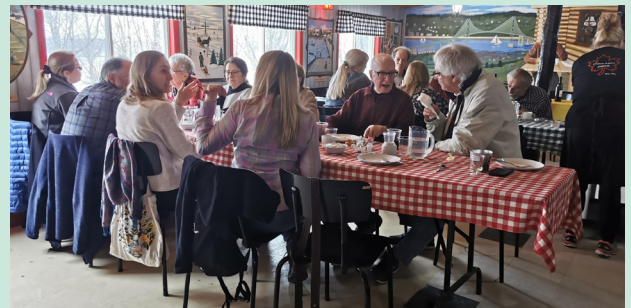
Association Bénévole de l'Île d'Orléans, repas reconnaissance