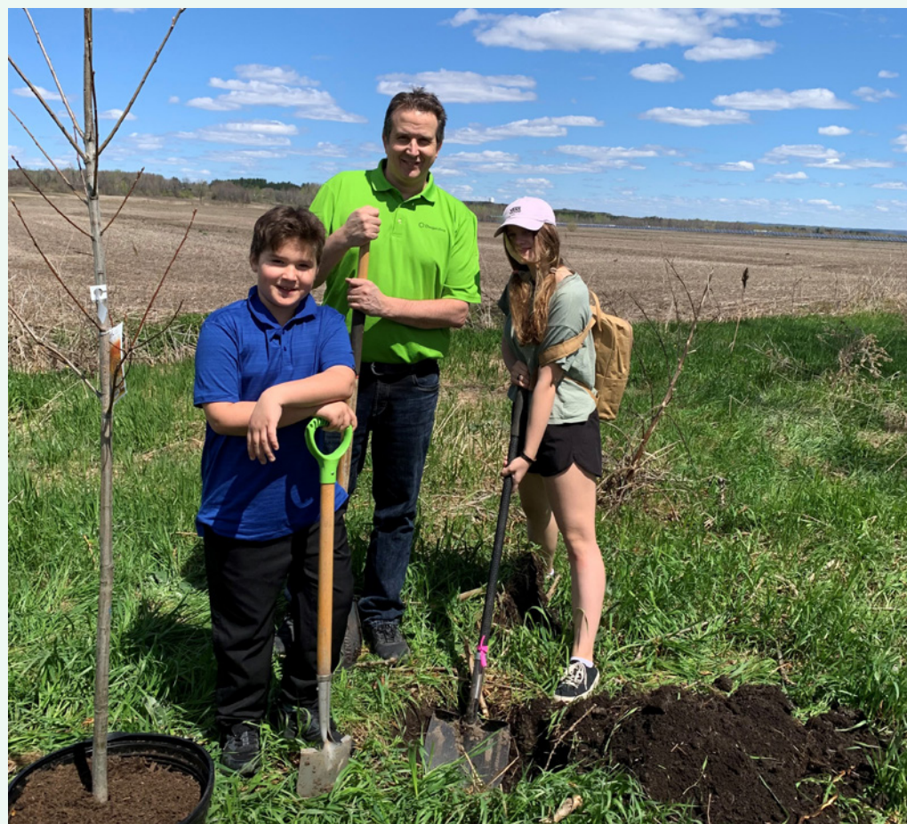
Plantation d'arbres dans le sentier récréatif de Prescott-Russell

La Caisse a participé à différentes initiatives qui visent à embellir notre planète et à sensibiliser les gens à faire des gestes concrets pour l'environnement. Les membres du personnel et de l'équipe administrative de la Caisse ont notamment pris part à des activités de collecte de déchets et de plantation d'arbres pour apporter leur contribution.