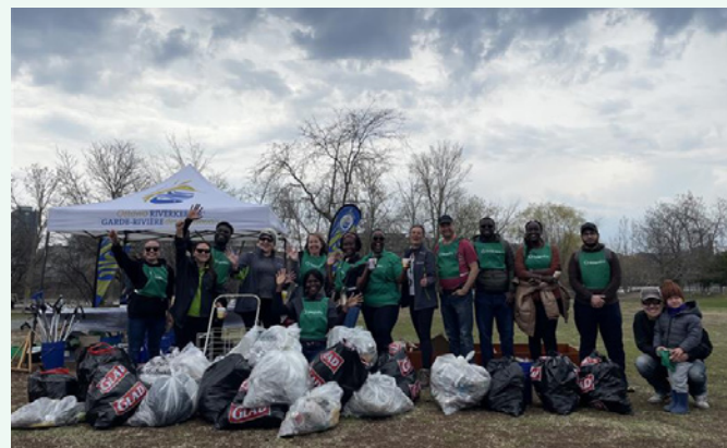
Nettoyage des déchets en bordure de la Rivière des Outaouais.