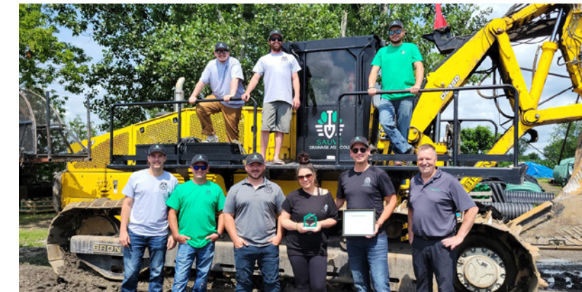
Sauvé drainage agricole inc. est une jeune entreprise de drainage implantée dans l'est et le nord de l'Ontario. Le soutien financier du Fonds C a permis à l'entreprise de se doter d'un système GPS et d'un système de contrôle d'équipements de pointe.

Grâce au Fonds C , la Caisse a remis 170 000 $ pour soutenir 19 projets d'entreprises de l'Ontario. L'aide financière offerte est non remboursable et peut atteindre 20 000 $ . Nous appuyons des projets dans les catégories suivantes : innovation, transfert d'entreprise, exportation, relève d'entreprise, initiatives écoénergétiques, mesures sanitaires ou ergonomie, transformation numérique, soutien psychologique et changement du modèle d'affaires.