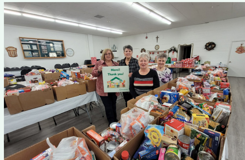
La Fédération nationale des femmes canadiennes françaises remet des paniers de nourriture pour la période des fêtes.