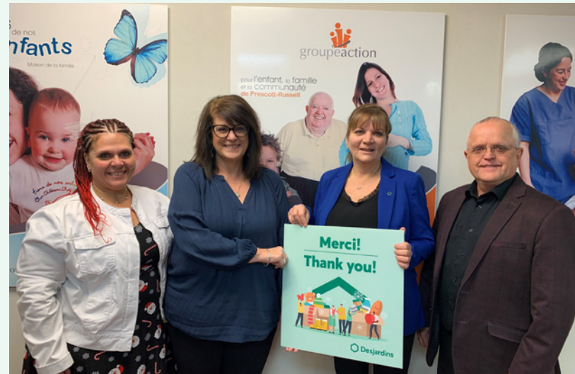
Le Groupe Action et la Maison de la famille de Hawkesbury font l'achat d'habits de neige pour les enfants de la région.