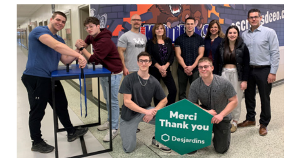
2 e édition du tournoi régional de tir au poignet de l'École secondaire catholique régionale de Hawkesbury