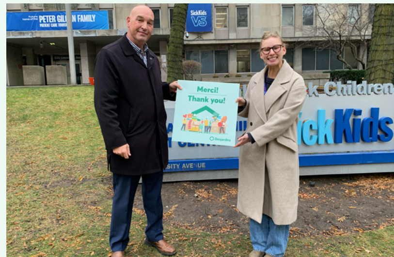
La Fondation SickKids vient en aide aux enfants malades de la région de Niagara Falls.