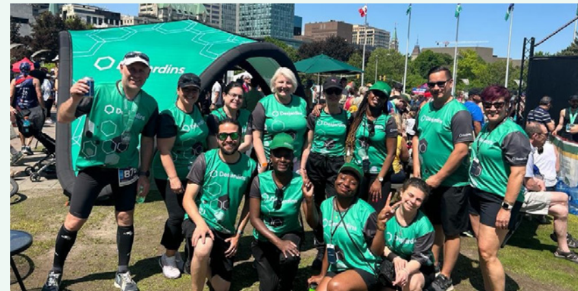
Courez Ottawa est une course attirant des coureurs et coureuses de partout et permettant d'amasser des fonds pour plusieurs organismes communautaires.

La Caisse Desjardins Ontario est partenaire de plusieurs courses communautaires en Ontario. Ces partenariats permettent d'appuyer différentes campagnes de financement pour des organismes de charité tout en faisant la promotion de la santé et de l'activité physique.