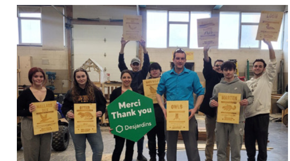
Fabrication d'enseigne pour les sentiers de bien-être

Les Prix Fondation Desjardins permettent aux intervenants et intervenantes des milieux scolaires et communautaires d'obtenir jusqu'à 3 000 $ pour réaliser un projet avec des jeunes de la maternelle au secondaire. Ce programme favorise la mobilisation du personnel enseignant de même que la persévérance et la motivation de milliers d'élèves. Plus de 250 000 $ ont été remis pour un total de 91 projets en Ontario.