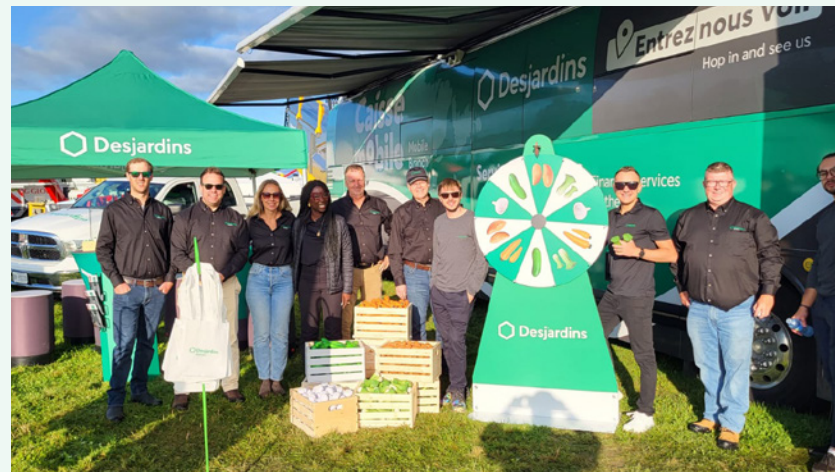
L'équipe agricole était présente au Salon agricole du Canada de Woodstock pour faire découvrir son offre de services financiers aux agriculteurs et agricultrices.