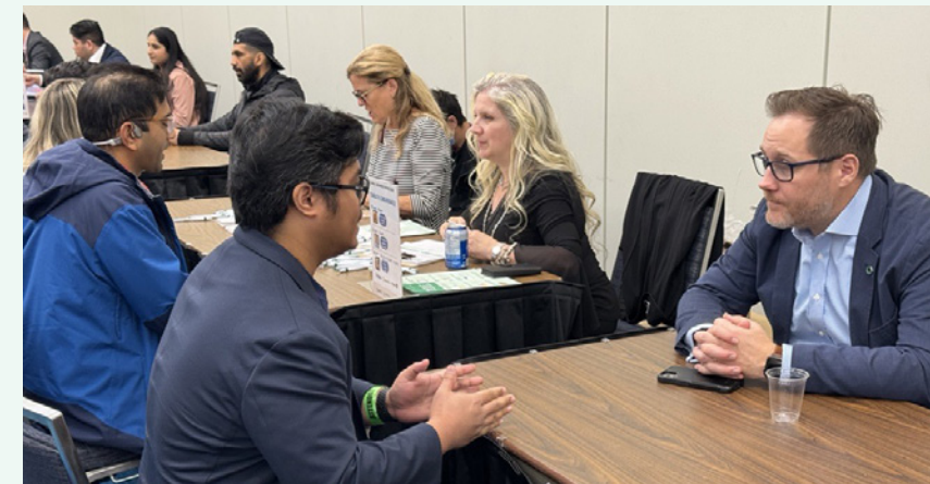
Dans le cadre du Forum des petites entreprises de Toronto, les personnes souhaitant devenir propriétaires d'une entreprise ont l'occasion de rencontrer l'équipe de Desjardins pour discuter de leurs projets et organiser les prochaines étapes de la réalisation de leur plan d'affaires.