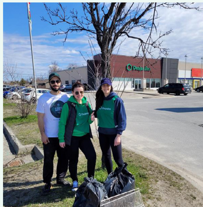
Nettoyage éclair des déchets à Sudbury