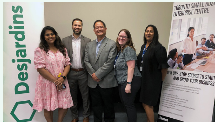
Grâce au partenariat entre la Ville de Toronto et la Caisse Desjardins Ontario, nous assurons une présence dans les centres pour les entrepreneurs et entrepreneures de North York et de Scarborough. Les échanges entre notre équipe de Desjardins Entreprises et les entrepreneurs et entrepreneures permettent d'aborder les besoins et les occasions d'affaires et de réaliser des plans concrets.