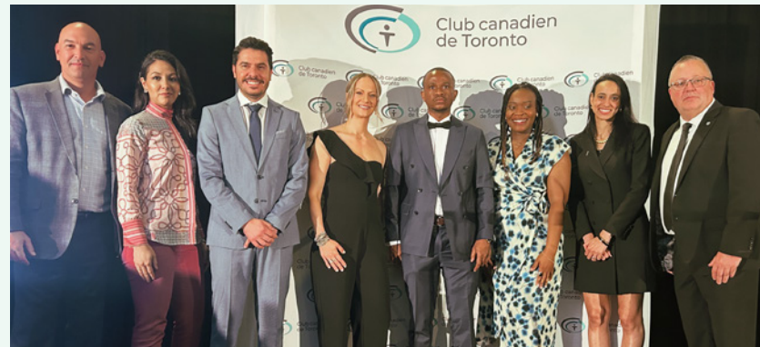
Nos gestionnaires étaient présents pour féliciter les jeunes récipiendaires des Prix RelèveON organisé par le Club canadien de Toronto.

La grande équipe du centre Desjardins Entreprises participe à des événements de plusieurs secteurs d'affaires pour rencontrer des propriétaires d'entreprises et discuter de leurs besoins financiers. Nos directeurs et directrices de comptes accompagnent les membres lors des différentes étapes du cycle de vie de leur entreprise et tout au long de sa croissance.