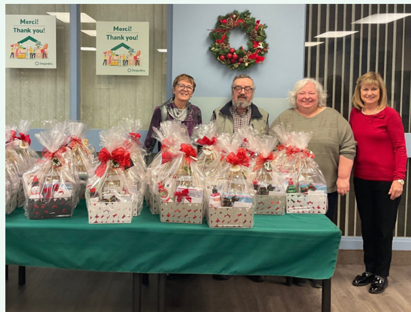
Paniers cadeaux remis par le Rendez-vous des aînés francophones d'Ottawa (RAFO)

La Caisse Desjardins Ontario est fière d'avoir remis 100 000 $ en dons à plusieurs organismes en Ontario afin d'aider les gens pendant la période des Fêtes et de répandre un peu de joie dans leurs foyers. Plusieurs banques alimentaires, programmes d'habits de neige et organismes tenant des activités pour les personnes démunies ont bénéficié d'un coup de pouce financier supplémentaire pour réaliser leurs projets.