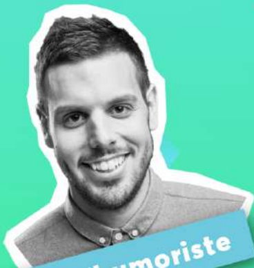
Avec l'humoriste Sam Breton

Date limite d'inscription 1 er septembre 2021